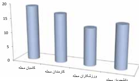
جلوگیری از آلودگی زیست محیطی، هوا و آلودگی صوتی

توسعه شهر و ماشینی شدن زندگی فواید بسیار خوبی به همراه داشته است. ولی این پیشرفت‌ها آلودگی‌های زیست‌محیطی، هوا و صوتی را به وجود آورده است. بنابراین وظیفه شهروندان در برابر کاهش این آلاینده‌ها به شکل متغیر با ذهنیت‌های افراد محله متفاوت خواهد بود. زیرا ساخت دستگاه‌ها و خودروهای استاندارد از طرف کارخانه‌های تولیدکننده مطرح می‌شود.